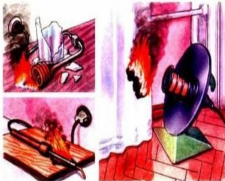
Оставление без присмотра электрических нагревателей kuhta.dan.su