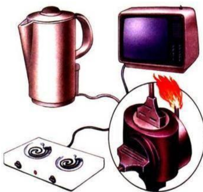
Перегрузка электропроводов kuhta.dan.su

9) Помни: от твоих первых действий зависит, насколько быстро будет распространяться дым и огонь по подъезду.