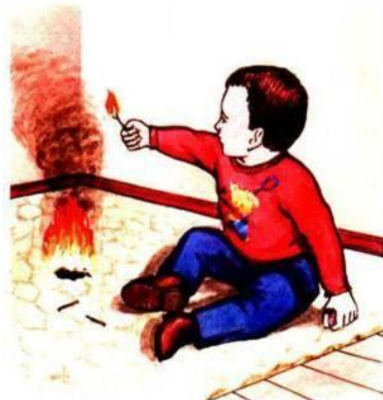
Детская шалость

ЗНАЙ: вызов пожарной команды просто так, из шалости или любопытства, не только отвлечёт спасателей от настоящего происшествия, но и будет иметь весьма неприятные последствия. Заведомо ложный вызов пожарных (так же, как и милиции, "скорой