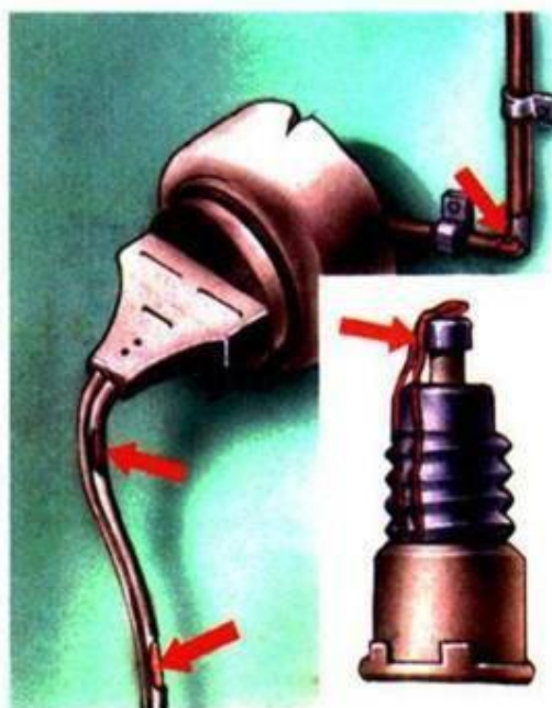
Неисправность электропроводки Пользование самодельными предо...

1) Если ты почувствовал запах дыма или увидел огонь, сразу позвони пожарным. Если огонь тебе не угрожает, сделать это можно с домашнего телефона. В других случаях лучше сразу покинуть квартиру, а затем вызвать пожарных по телефону 01. Обязательно сообщи о пожаре взрослым.